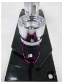
アタッチメント③プレート（下の台）の③に入れる