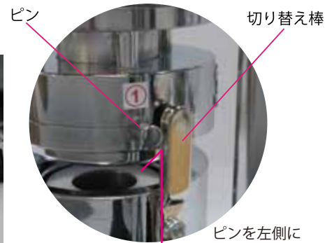
ピンを左側に切り替え棒とピンの間隔を2~3mm程度空ける