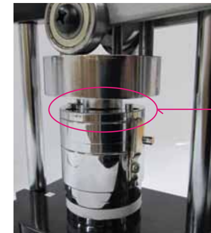
アタッチメント③の場合レバーを下げるとピンが上の金具の穴に突き抜ける