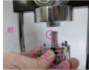
ピンの方向を合わせる