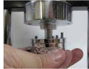
アタッチメント①を押し込む