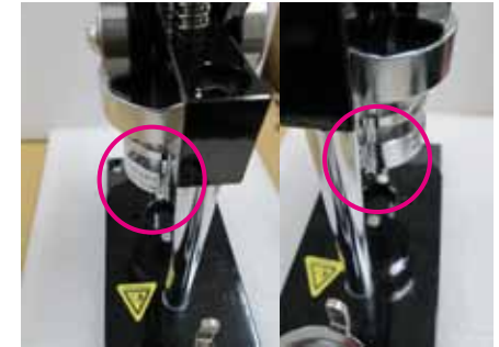
ピンをこの位置位で仮止める