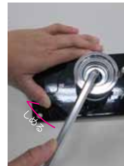
位置が決まればネジをしめてください