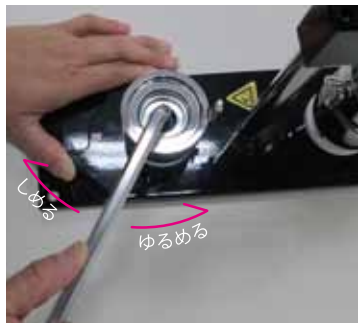
六角レンチでネジをゆるめる