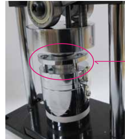
アタッチメント②の場合レバーを下げるとピンが上の金具の穴に突き抜けずに手前で止まる