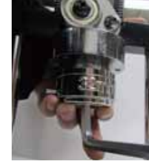
六角レンチでネジを締める