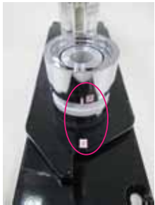
アタッチメント②プレート（下の台）の②に入れる