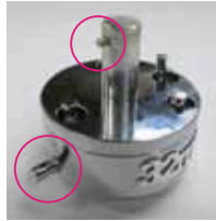
ピンの方向を合わせる