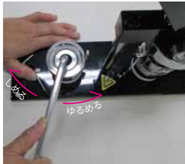
六角レンチでネジをゆるめる