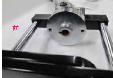
本体の穴に入れる