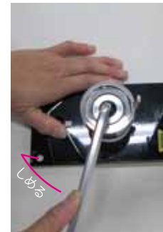
位置が決まればネジをしめてください